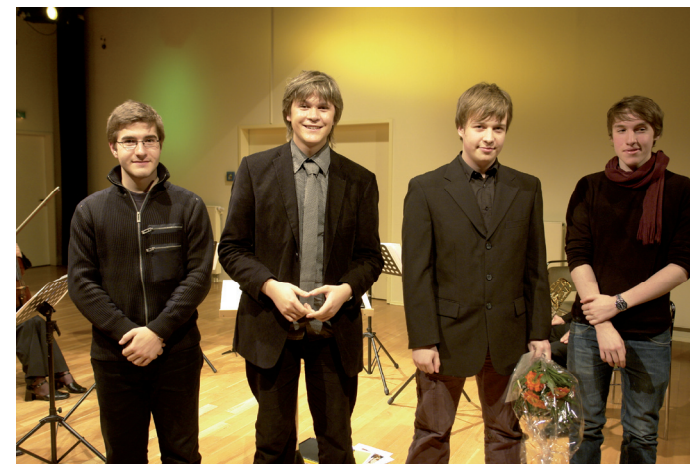
17. Tonkünstlerfest 2008: Preisträger des 15. Jugend-Kompositions-Wettbewerbs