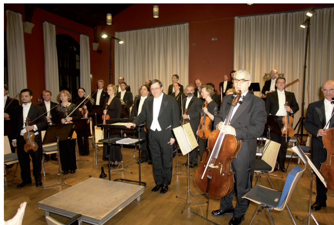
17. Tonkünstlerfest 2008: Mitteldeutsche Kammerphilharmonie