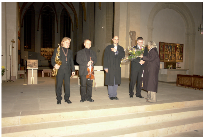
17. Tonkünstlerfest 2008: Kathedrale St. Sebastian