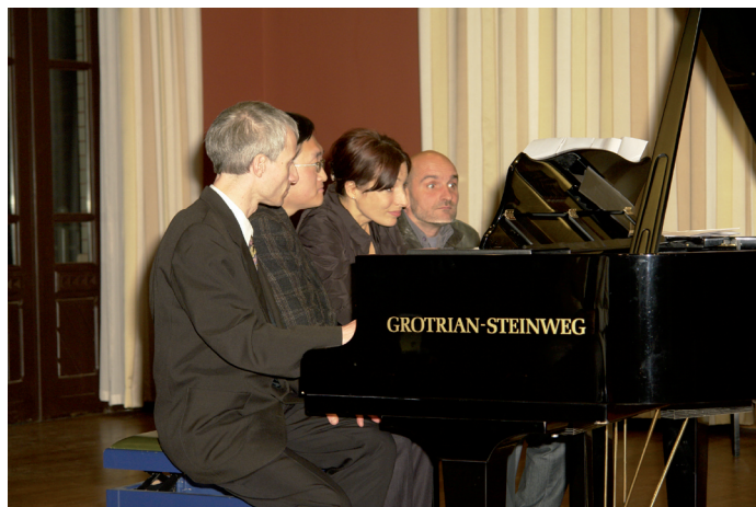
17. Tonkünstlerfest 2008: Abschlusskonzert