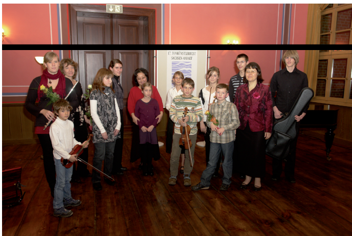
17. Tonkünstlerfest 2008: Lehrer und Schüler im Konzert